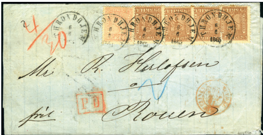
1546 B 9,10. 104 skillings porto til Frankrike. 8 skill og fire 24 skill på firevektig brevomslag til Rouen.stemplet «Throndhjem 6.6.1865». «Sandøsund» samt franske transitt- og ankomststempler på for- og baksiden. Baksiden har noen anmerkninger. Ikke registrert i NK. Ex Burrus Tilslag kr 72.000,-.