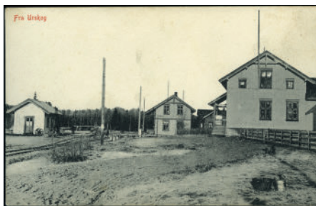
Objekt 1081 Bleiken stasjon kr kr 1.700,- + ett av kortene i lott 1176 som ble solgt for kr 18.500,-.