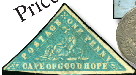
2246: Collection Cape of Good Hope triangulars to 1861. Realised NOK 220,000.