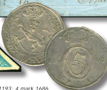
1193: 4 mark 1686. (NM 81). 1+. kr 135.000,-.

Dette ble en av våre største og mest interessante auksjoner til nå. Fordi vi har et nytt auksjonssystem under utvikling, valgte vi å avholde kun én auksjon dette året. Den ble til gjengjeld en veldig stor suksess!