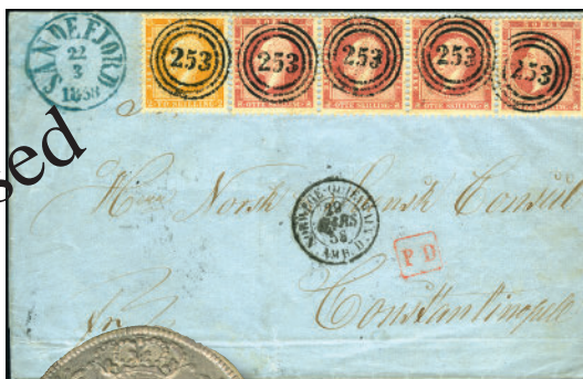
1478: 34 skillings porto til Tyrkia i 1858. Kr 62.000,-.