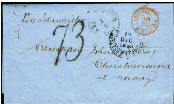
Objekt 1437 B Kom- plett dobbeltvektig brev fra Manila, Phillipinene 10. desember 1859 til Christiansund. Pstemplet portotall «73» samt «via Suez amb». Transittstem- plet «Paris» og «Svine- sund» på for- og bakside. Tilslag kr 15.500,-.